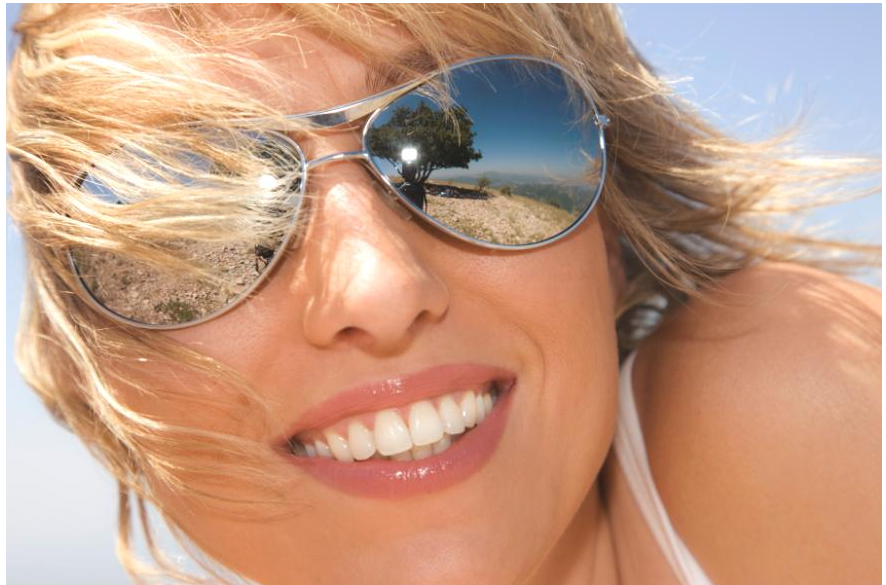
Wenn man schöne weiße Zähne hat, kann man unbefangen reden und lachen. Es macht Spaß, solche Zähne zu zeigen!

Daneben gibt es Fälle, in denen Zähne durch Fluorid-Überdosierungen fleckig werden (die sog. Fluorose ).