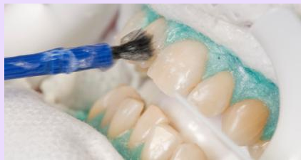
Power-Bleaching in der Zahnarztpraxis: Nachdem das Zahnfleisch zum Schutz abgedeckt wurde, wird hochkonzentriertes Bleaching-Gel auf die Zähne aufgetragen. Nach ein bis eineinhalb Stunden sind die Zähne deutlich heller.

So bezeichnet man im Englischen das schnelle Aufhellen in der Zahnarztpraxis. Dabei werden die Zähne vorab gereinigt und das Zahnfleisch mit einem speziellen Schutz abgedeckt.