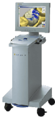
Cerec-Gerät zur Herstellung von Inlays, Kronen, Brücken und Veneers aus Keramik.

Wir fertigen in unserer Praxis Keramik-Inlays mit Cerec*. Dafür braucht man keine Abformung, kein Provisorium, meistens keinen weiteren Termin und auch keine zweite Betäubungsspritze mehr.