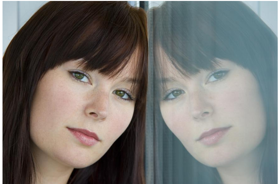
Wer unzufrieden mit dem Aussehen seiner Zähne ist, traut sich oft nicht, sie zu zeigen. Wie können Zähne schöner gemacht werden? Wie funktioniert Bleaching? Was sind Veneers? Hier bekommen Sie die Antworten.