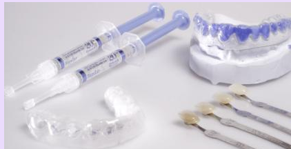
Home-Bleaching-Set: Bleaching-Gel (links oben) und Trägerfolie (links unten), die mit dem Bleaching-Gel über die Zähne gestülpt wird. Rechts oben das Gipsmodell, auf dem die Trägerfolie hergestellt wurde.

Beim Home-Bleaching hellen Sie Ihre Zähne zu Hause auf. Die dafür notwendigen Hilfsmittel erhalten Sie vom Zahnarzt. Er kontrolliert vorab, ob Ihre Zähne für das Bleichen geeignet sind und lässt