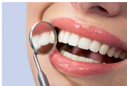
Harmonisch und ästhetisch wirkende Zahnreihen durch Kieferorthopädie

schen Kräften arbeitet und trotzdem meistens schneller geht als die konventionelle Kieferorthopädie. Das bedeutet: Weniger Kontrolltermine und schnellere Ergebnisse.