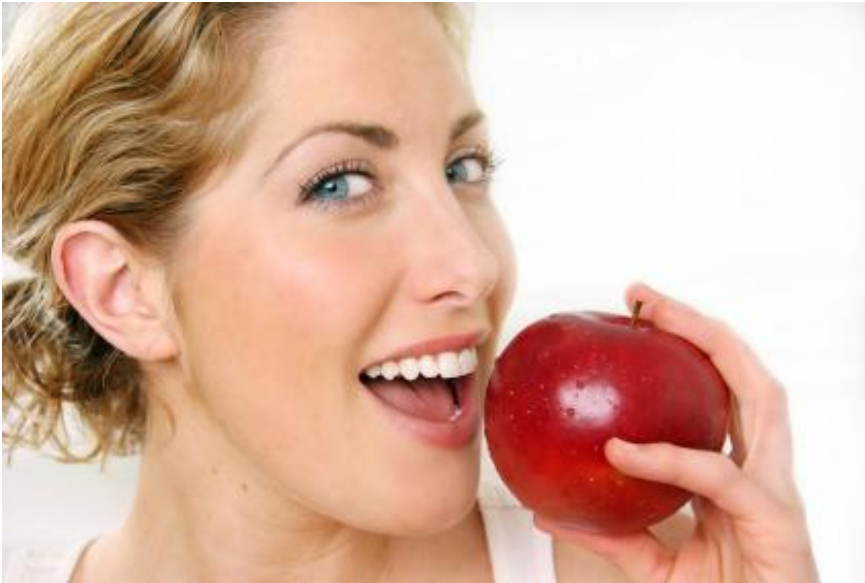
Der Apfel-Test: Blutet Ihr Zahnfleisch beim Hineinbeißen oder nicht? Blutendes Zahnfleisch ist immer ein Warnsignal! Es ist entzündet; vielleicht besteht schon eine Parodontose. Warum müssen entzündetes Zahnfleisch und Parodontose behandelt werden?

Wird leider oft auf die leichte Schulter genommen: