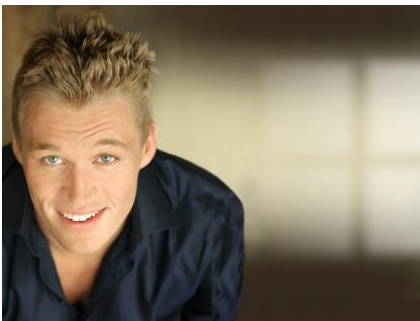
Zähne können jederzeit einfach und schnell wieder nachgehellt werden.

Ist das Nachdunkeln ein Problem? Eigentlich nicht! Die Zähne können jederzeit wieder nachgehellt werden. Das geht viel schneller als bei der ersten Aufhellung und ist preisgünstiger.