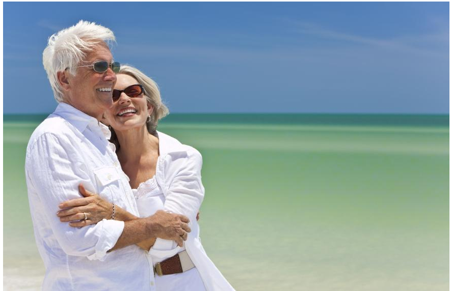
Mehr Spaß und Lebensqualität mit Zahnersatz aus reiner Keramik: Keine sichtbaren Metallteile. Kein Metallgeschmack im Mund. Gleichbleibend schöne Farben. Natürliches Aussehen.